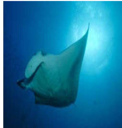
Bananareef , riesen Korallenblöcken. Demon Point, Riffhaien, Schildkröten, Barrakudas. Bushy Westside ,Manta- u. Adlerrochen.